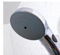
●手元スイッチ付きシャワー

●ミストサウナ付カワック 「美容」「健康」「リラクゼーション」の3つの効果で人気のミストサウナ。約40度のミストでやさしく包んで暖めるので、お肌もしっとり。