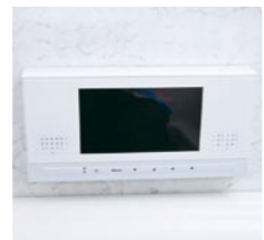
●浴室TV 地上デジタル対応7型液晶TVでくつろぎのバスタイムを。