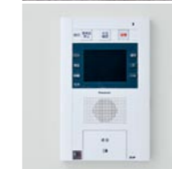
●ホームセキュリティ「アイルス」(フェリカ対応)