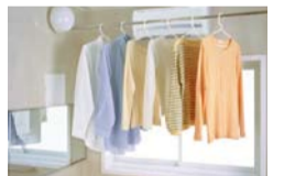
浴室暖房乾燥機 カワック

寒い日でも快適に入浴できる暖房機能と、雨の日や夜でも洗濯物がしっかり乾く乾燥機能を搭載。スイッチを押すだけで浴室から湿気を追い出し、カビの発生も抑えます。