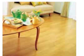
ガス温水式床暖房(ヌック)

床下からの「ふく射熱」でお部屋全体をムラなく暖める床暖房。理想的な「頭寒足熱」の暖房なので20℃程度の室温でも暖かく、長時間つけていてもほせることがありません。